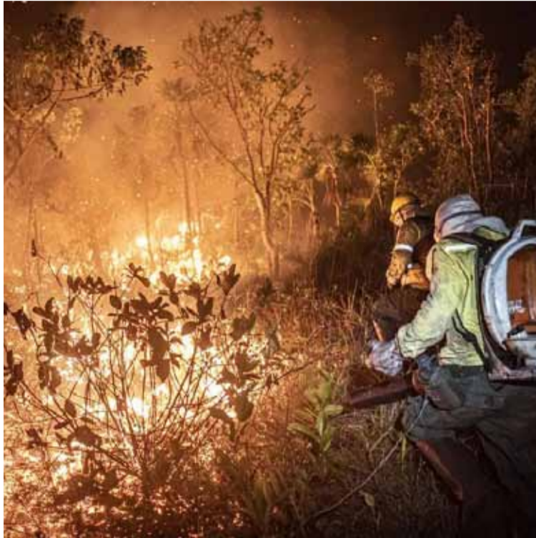
Un infierno. Se detectaron más de 2.300 focos de incendios

En la Amazonia, el estado de Pará registró 466 focos en las últimas 48 horas. Mato Grosso registró 189 focos. Matopiba (región que incluye parte de los estados de Maranhão, Tocantins, Piauí y Bahía),