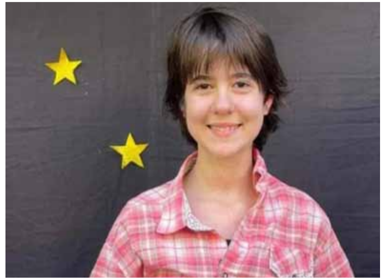
Responsabilidad. La mamá de Juanita señaló a las autoridades escolares

El costo del alquiler representa una carga pesada para los adultos mayores, cuyos ingresos mensuales oscilan entre $135.000 y $276.500. Después de cubrir el alquiler, el margen económico para satisfacer necesidades básicas como alimentación y medicamentos es muy reducido. La Canasta Básica Alimentaria para un adulto mayor varía entre $62.000 y $96.000, dependiendo del género, lo que deja poco espacio para gastos imprevistos. (DIB)