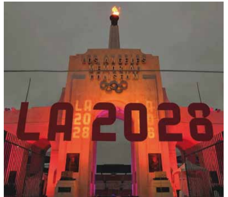
Los Ángeles albergará la próxima edición de la cita olímpica

El Comité Olímpico Internacional (COI) tomó la determinación de excluir al boxeo de la lista de deportes que estarán presentes en los Juegos Olímpicos de Los Angeles 2028.