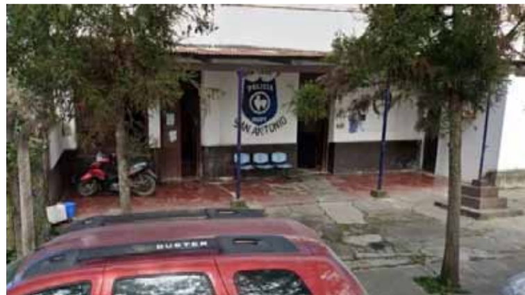
En Jujuy. Los vecinos salvaron a la víctima, quien se encuentra fuera de peligro

Una ambulancia derivó al hombre al hospital Pablo Soria de San Salvador de Jujuy, en el que quedó internado en la sala de shock room.