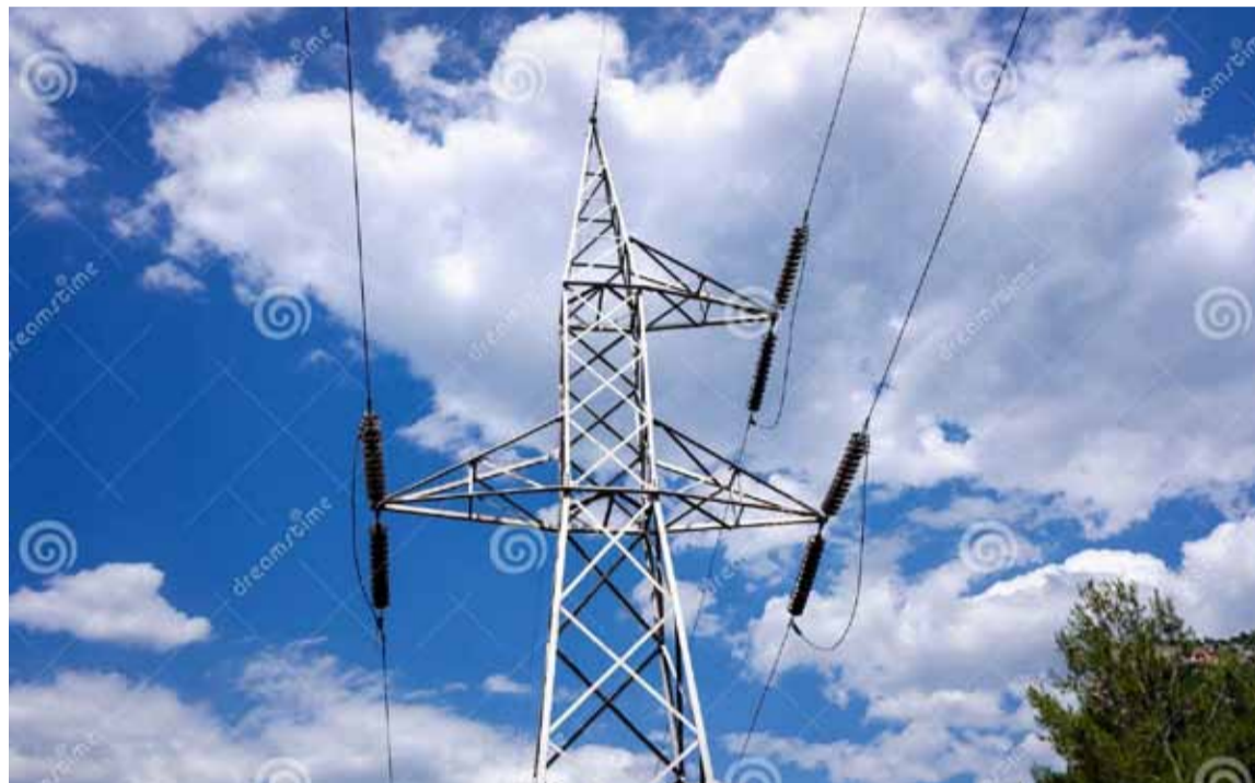
Lo estableció el ENRE a través de la Resolución 743/2024

El ENRE avisó a todas las empresas implicadas que se suspende la audiencia pública que había sido convocada a comienzos del mes