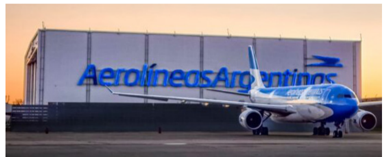
La postura del gobierno no

El presidente Javier Milei confirmó que el Gobierno intentará avanzar con el proyecto del PRO para privatizar Aerolíneas Argentinas, pero anticipó que si el Congreso traba la iniciativa "se la entregaremos a los empleados".