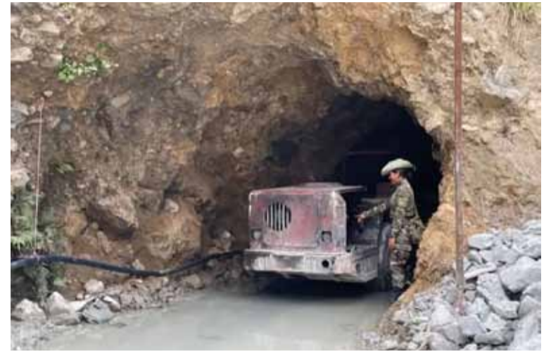
En Perú. En Patatez está la minera Poderosa

La Policía Nacional del Perú (PNP) descubrió en los últimos días los restos de al menos 16 personas en una fosa común ubicada en un socavón de una mina en la provincia de Patatez, en la región norteña de La Libertad, informaron medios locales de comunicación. La estatal “Tv Perú” señaló que efectivos policiales y de rescate “encontraron al menos 16 cuerpos”, elevando así la cifra inicial que daba parte del hallazgo de 12 restos humanos.