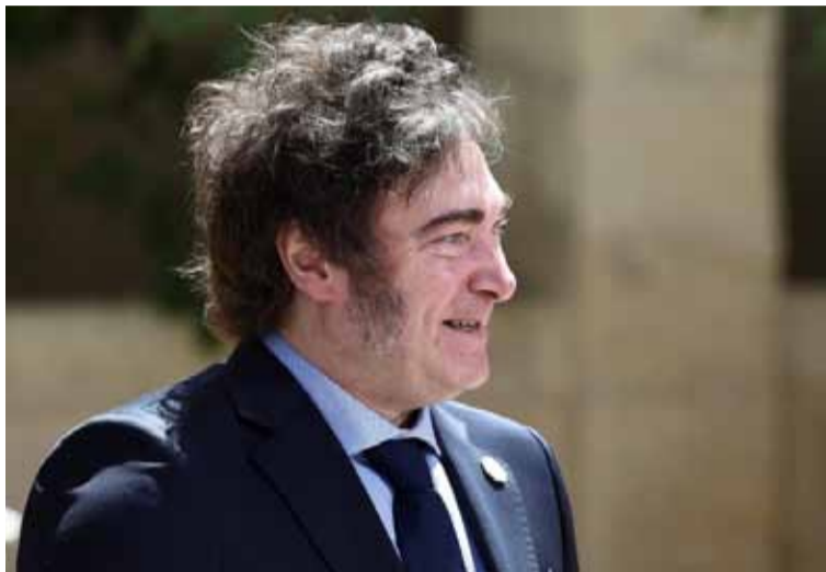
Aclaración del presidente, sobre su postura respecto a la universidad

Lo está en discusión, según Milei, es la intención del Gobierno de auditar los fondos que reciben