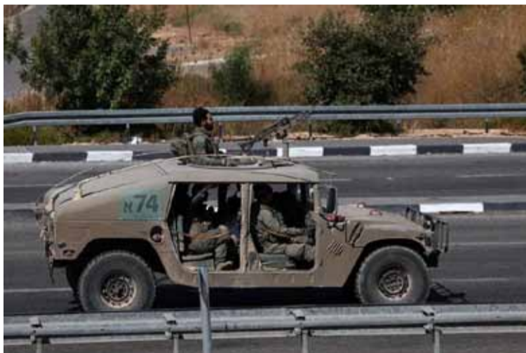
Israel cuestionado. Soldados israelíes a bordo de un vehículo militar en un lugar no revelado

Organizaciones como HRW y las autoridades libanesas han denunciado en anteriores ocasiones el uso de armas prohibidas por parte de Israel, como el fósforo blanco, una sustancia que cuando se expone al oxígeno provoca una reacción química capaz de causar quemaduras graves que pueden adentrarse hasta el hueso.///