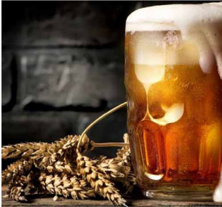
Impulsar la producción. En la provincia se maltea más de 300.000 toneladas de cevada

En los considerandos del decreto se advierte que “la provincia de Buenos Aires maltea