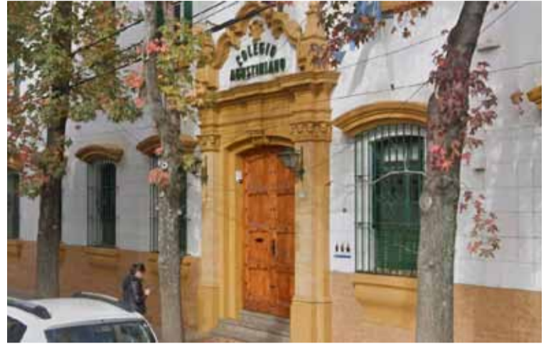
En San Martín. Escándalo en el Colegio Agustiniano de San Andrés

Sucedió en el Colegio Agustiniano de San Andrés, en el partido bonaerense de San Martín. Un adolescente de 15 años vendía fotos de sus compañeras modificadas con Inteligencia Artificial (IA) para que parecieran desnudas. Se estima que hay al menos 22 estudiantes afectadas de entre 13 y 17 años. La Policía allanó la vivienda del joven y la Justicia trabaja en determinar la imputación que le podría caer al acusado, que continúa asistiendo a clases.