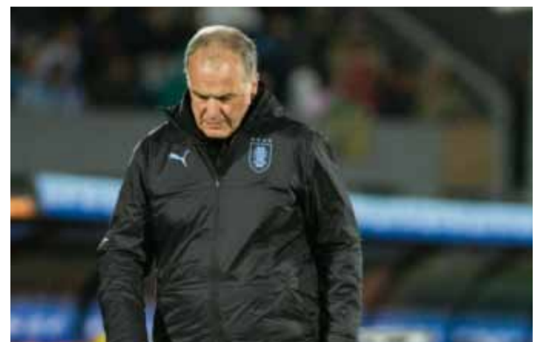
Bielsa muy preocupado

Las dos deberán mejorar y mucho de cara a la próxima doble fecha de noviembre porque, más allá de que hoy en día están entre las que se clasifican directamente