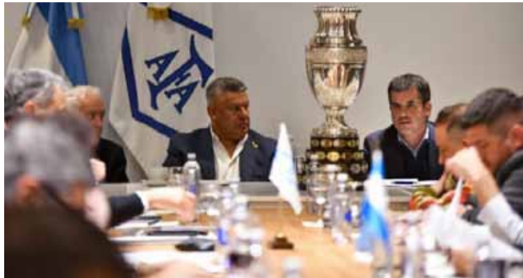
"Chiqui" Tapia busca ser reelecto al mando del fútbol argentino

Además de la cuestión electoral, también quedan así canceladas la reforma del torneo de la Liga Profesional, que iba a pasar a tener 30 equipos a partir